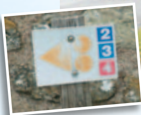
Randonnée en roulotte.