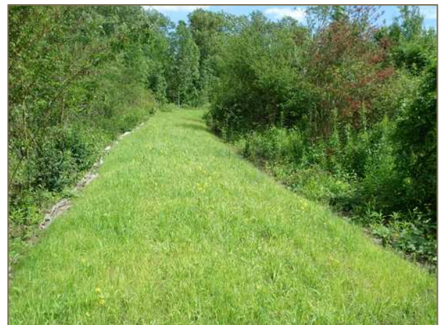
Chemin circulaire en mélange terre-pierre

Le mélange terre-pierre est un revêtement perméable.