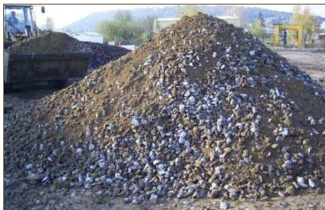
Mélange terre-pierre avant sa mise en œuvre

Suite à la réalisation du semis, il faut que les espèces aient le temps de se développer . Il est alors fortement recommandé d'interdire toute circulation sur la zone durant cette période.