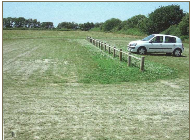
Parking en mélange terre-pierre Herbe grillée par la sécheresse