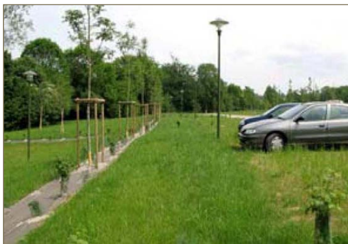
Parking en mélange terre-pierre